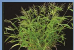
वैज्ञानिक नाम Brachiaria ramosa